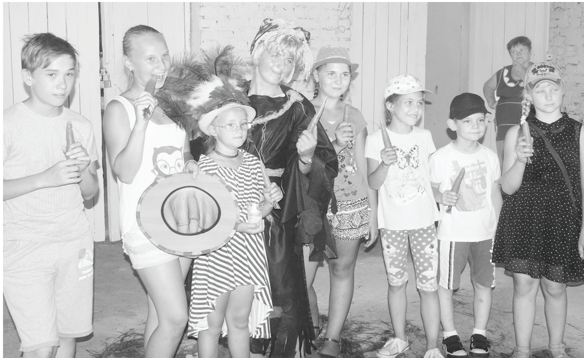
Баба-Яга и ее команда.