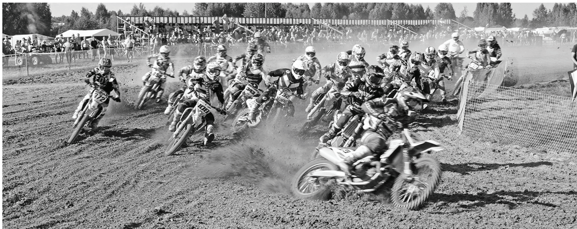
После старта в Свободном классе.