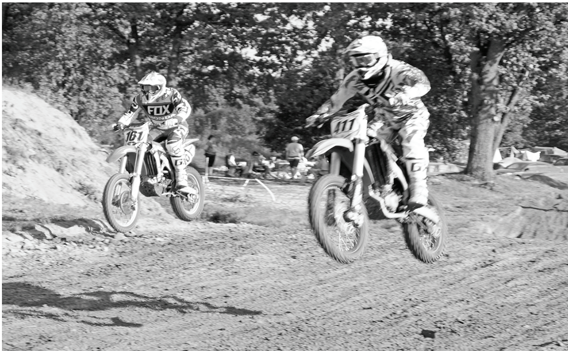
Борьба в классе «Хобби».