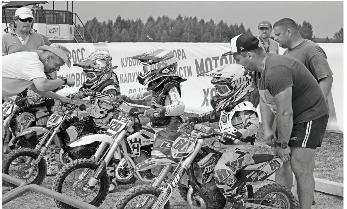
На линии старта — малыши.

Стартовая толча — дело опасное. Это потом, через минуту, гонщики так растянутся по трассе, что